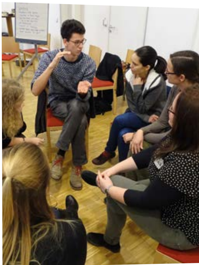
WeltWegWeiser-Training zu inklusiven Methoden

Hinweis: Es gibt in verschiedenen Förderprogrammen die Möglichkeit, zusätzliche Fördermittel für ein Reinforced Mentorship zu beantragen. Partnerorganisationen von WeltWegWeiser können solche direkt im Rahmen einer Mehrbedarfsförderung beantragen.