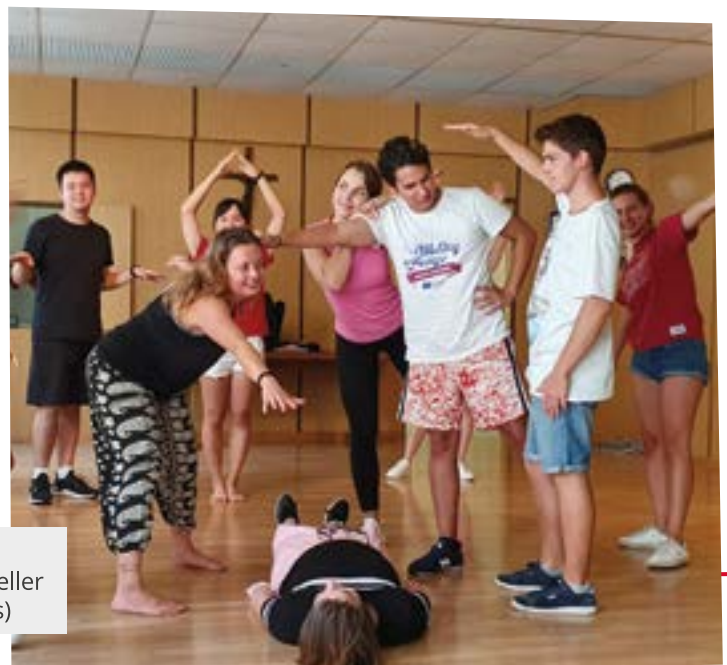
Inklusives Training von Grenzenlos – Interkultureller Austausch

Als Plan B können Rückkehrer_innen mit Behin-